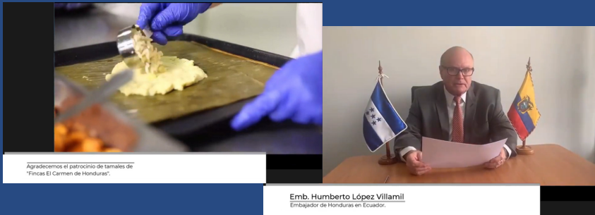
Agradecemos el patrocinio de tamales de "Tricel El Carmen de Honduras"